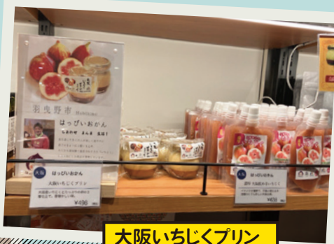
大阪いちじくプリン 大阪飲めるいちじく