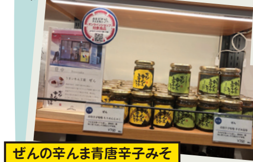
ぜんの辛んま青唐辛子みそ