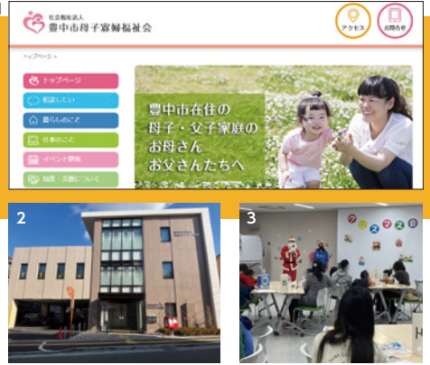
1:歴史は古く、戦後すぐからひとり親家庭への様々な支援を行ってられます 2:豊中市立母子父子福祉センター外観(地域共生センター東館内) 3:クリスマスイベント開催の様子

担当者が理解していないと従業員にも説明できないので、そんな状況に気軽に相談でき、適切なアドバイスをもらえる心強い存在です。