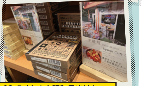
黒毛和牛すじの大阪和風出汁カレー その他大阪出汁カレー各種