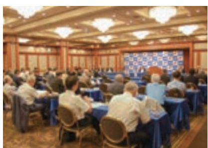
▲ 議件の審議を行う役員議員

「企業づくり」では、大阪府から承認を受けた「小規模事業者経営支援事業」の推進により、新たな成長分野へ果敢にチャレンジする企業を着実に発掘し、実践型セミナーや伴走型による課題解決支援に取り組んできた。また、デジタル技術を活用した自己変革への挑戦を実践的に後押しするため、豊中市と連携して「ITコンシェルジュ派遣事業」を積極的に展開してきた。さらに、経済産業省の「認定経営革新等支援機関」として、専門派遣事業などを積極的に展開し、高度専門的な経営課題の解決に向けた支援体制の強化を図ってきたところである。